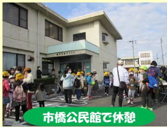
市橋公民館で休憩