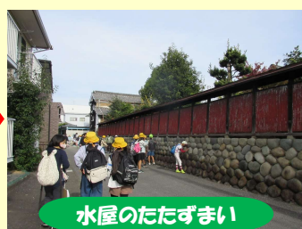
水屋のたたずまい