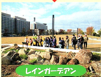
レインゲージアーン