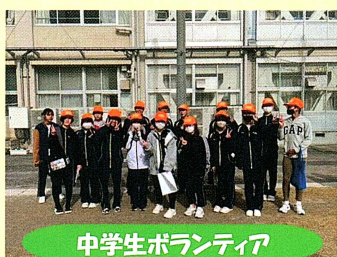
中学生ボランティア

県庁について新しいことがわかって勉強になった。 グループのみんなで相談して答えを出す時が楽しかった。 グループのみんなで話しながら歩いたことが楽しかった。